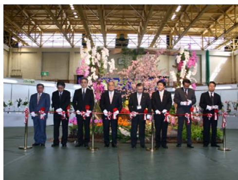
らんフェスタ2008 (赤平市)