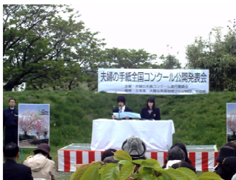
夫婦の手紙全国コンクール (松前町)