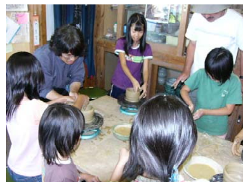
トライ☆アス☆カル2008サマーアート キャンプin江別 (江別市)